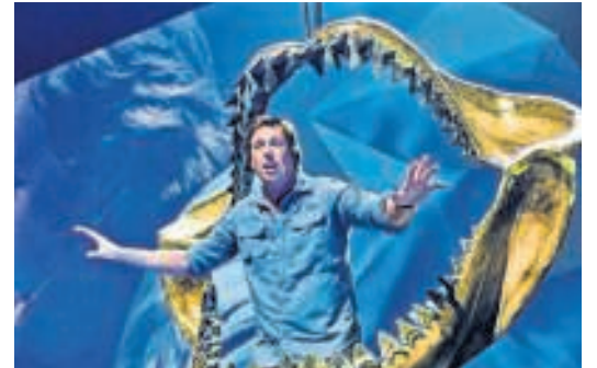
▲ Freek Vonk leert kinderen graag over het dierenrijk.

Wat: Freek Vonk Op Wereldreis Gezien: Theater de Kring, Roosendaal, 19 mei Nog te zien: tot eind juni, freekvonklive.nl